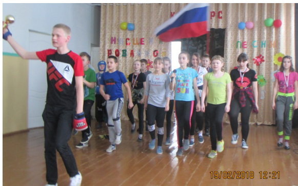
на фото: 6 «а» и 6 «б» классы