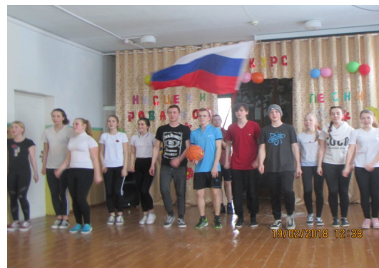
на фото 9 класс