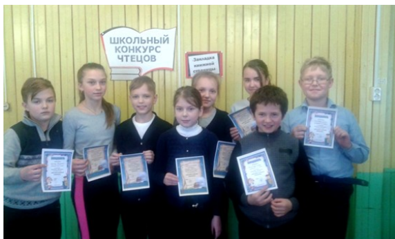
на фото: возрастная группа 10-13 лет