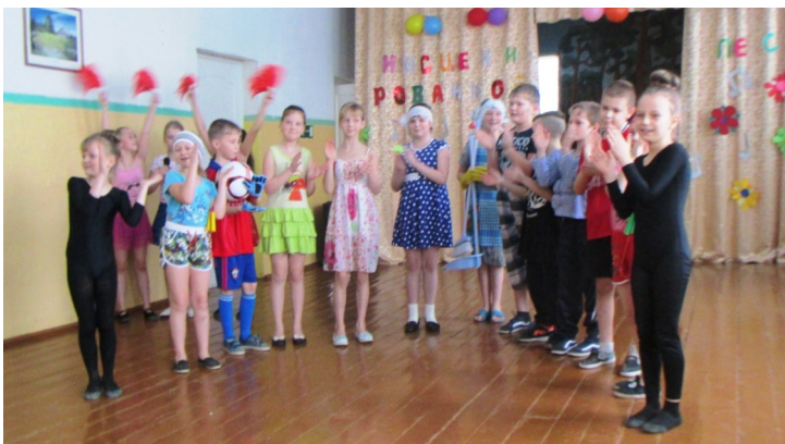
на фото: 3 класс